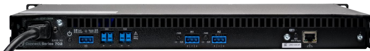
Connect 702 背面

Connect シリーズは、小規模から中規模の施設に適したパワーアンプです。2/4/8ch のラインナップで、それぞれに Dante 搭載モデルがあります。ローインピーダンスまたはトランスレス接続できるハイインピーダンス(70V/100V)の接続が可能で、各チャンネルごとに切り替えができます。Analog Devices 社製 96kHzDSP を搭載し、最大 48dB/Oct のクロスオーバーフィルター、8 バンド PEQ、スピーカー保護リミッターなど、多彩な機能を搭載しています。アンプへの接続には、内蔵の Wi-Fi アクセスポイントを使用する、既存 Wi-Fi ネットワークから接続する、または高速 10/100MB イーサネット接続する、の 3 つの方法があります。ソフトウェアのダウンロードが必要なく、Web UI で PC やモバイルデバイスからリモートコントロール、監視、通知など、多様な制御が可能です。さらに、クラウドからの接続も可能です。Connect シリーズは、LEA Professional Cloud(2020 年サービス開始)に対応した初めてのプロフェッショナルパワーアンプシリーズです。LEA Professional Cloud と Web UI を使用することで、監視や予防のシステムメンテナンスを遠隔で行うことが可能です。