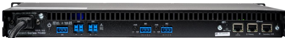
Connect 702D 背面